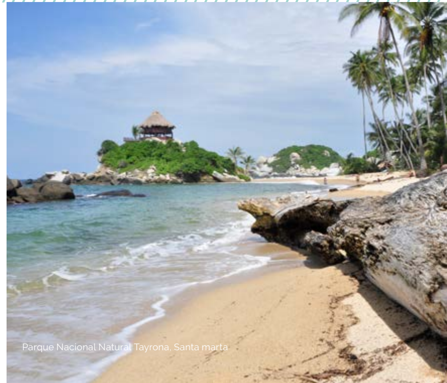
Parque Nacional Natural Tayrona, Santa marta